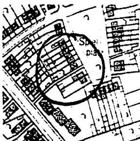
Abbildung 1- falsch

Um Bauverzögerungen und ggf. Baustilllegungen zu vermeiden, sollte der Antrag frühzeitig – d.h. mindestens drei Monate vor Baubeginn beim zuständigen Ordnungsamt eingereicht werden.